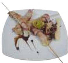
Spiedini di tosone alla piastra con pancetta DOP

APERTURA RISTORANTE ORE 18:30 TUTTE LE SERE